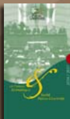
Synthèses et plaquettes d'information