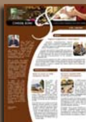
Conseil Echo trimestriels