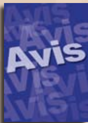
Schéma régional d'organisation sanitaire révisé