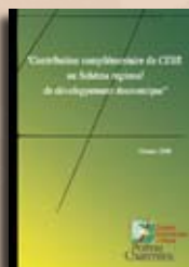
Schéma régional de développement économique

le Conseil régional demande au CESR de mener un travail d'approfondissement sur « la construction de l'offre de formation, sur les conditions de mise en œuvre de passerelles formation initiale / formation continue et sur un pôle régional d'éducation et de formation ». Les préconisations et leviers d'actions proposés ont notamment pour objectif de mieux inscrire la formation professionnelle dans le système d'éducation et de formation.