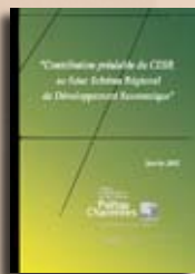
Schéma régional de développement économique Contribution préalable, janvier 2005

Vœu sur le Centre Régional Information Jeunesse