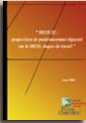
Schéma régional d'organisation sanitaire (SROS) Avis, mars 2006

Pour le CESR, le projet de SROS doit répondre aux besoins des populations et contribuer à l'aménagement du territoire. Dans cet objectif, son élaboration doit respecter un certain nombre de principes, qui restent à ce jour à réunir. Par conséquent, l'assemblée socioprofessionnelle estime que le projet du SROS n'est pas recevable en l'état.