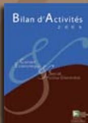
Bilans d'activités annuels