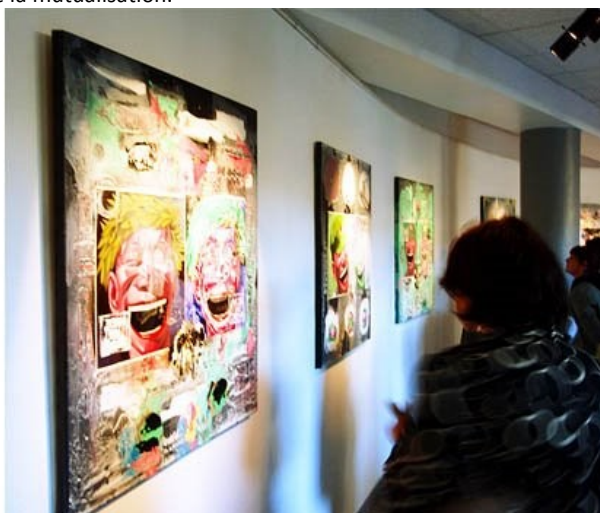
Exposition de Claude Husson au Local – Poitiers (86)