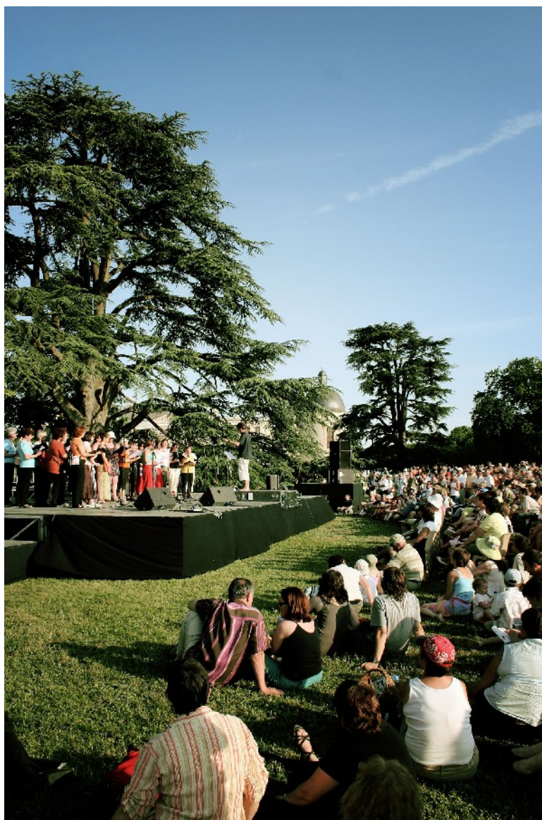
1001 Scènes – Oiron (79)

La culture contribue à l'émancipation des personnes dans la reconnaissance de leur singularité.