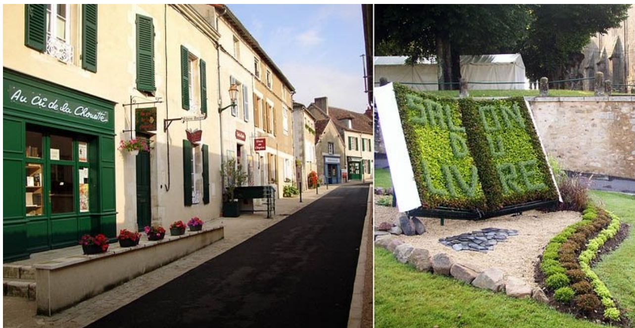
Cité de l'écrit – Montmorillon (86)

Il en existe environ 130 sur le territoire régional , ce qui classe Poitou-Charentes dans une bonne moyenne. Le réseau semble bien structuré, aussi bien grâce aux aides de l'Europe, de l'Etat que des collectivités locales. Les territoires ruraux comme les agglomérations sont bien dotés. Quelques exceptions : Angoulême, Châtelleraut, Soyaux et Chauvigny.