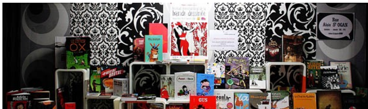
Festival international de la Bande dessinée – Angoulême (16)

La littérature, le régionalisme et la BD sont les 3 disciplines phares en région.