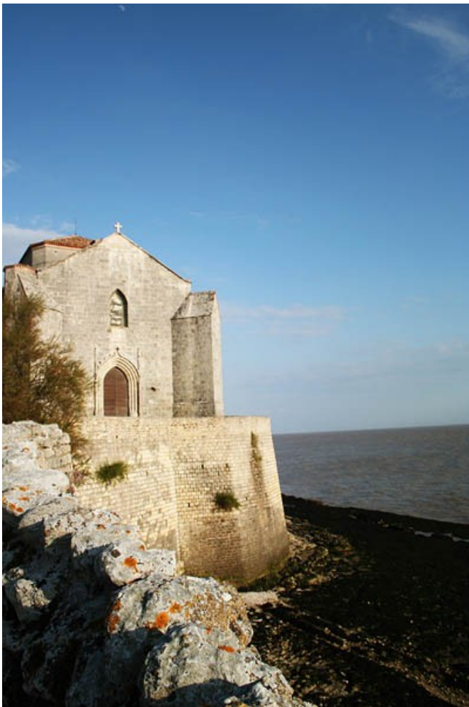
Eglise Sainte Radegonde – Talmont sur Gironde (17)

De longue date, il existe un partenariat entre collectivités publiques pour les grands axes d'intervention (édifices, patrimoine bâti). L'Etat est responsable de l'état sanitaire et collabore avec les collectivités territoriales pour les plans de restauration.